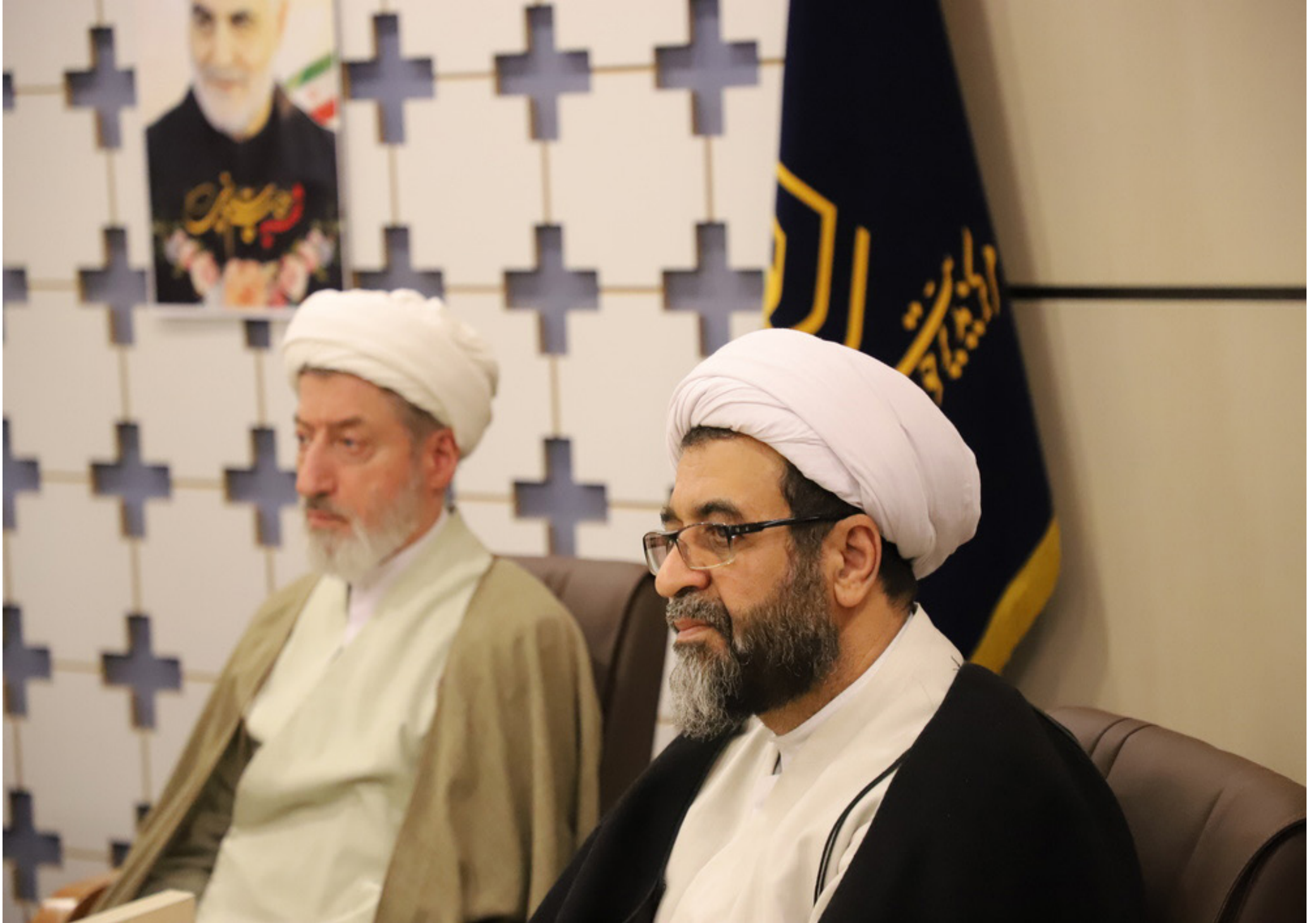
در نشست نمایندگان گروه های علمی - آموزشی حوزه های علمیه خاوران تبیین شد؛