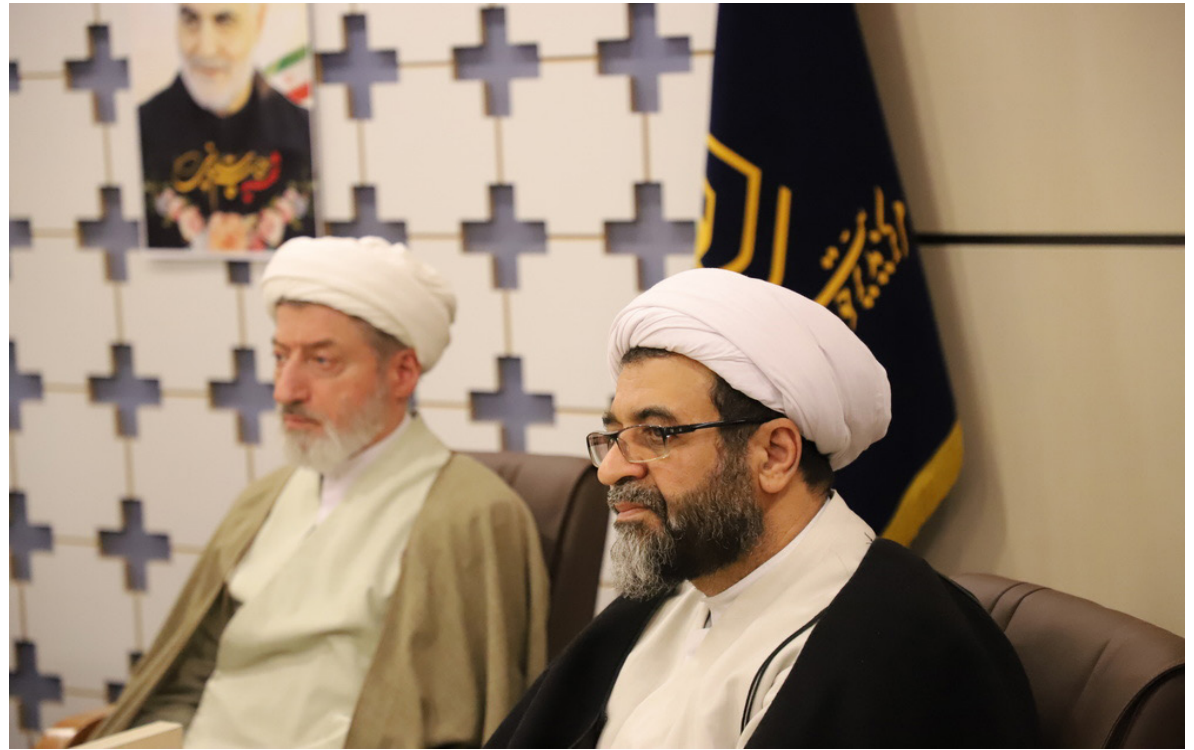
مدیر حوزه های علمیه خوارهران در نشست نمایندگان علمی-آموزشی که در سالن همایش شهید سلیمانی برگزار شد، با اشاره به نقش گروه های علمی-آموزشی در تربیت بانوان مجتهده را در راستای چشم انداز ۱۴۱۴ از هوش مصنوعی در آموزش و پژوهش تأکید کرد و گفت: پشتیبانی از دانش و مهارت جوویان، بر لزوم بهره گیری تربیت بانوان مجتهده را در راستای چشم انداز ۱۴۱۴ در