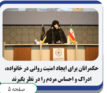
حکمرانان برای ایجاد امنیت روانی در خانواده، ادراک و احساس مردم را در نظر بگیرند