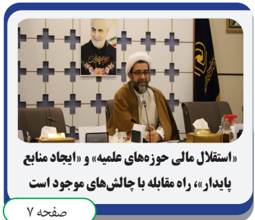
«استقلال مالی حوزه های علمیه» و «ایجاد منابع پایدار»، راه مقابله با چالش های موجود است