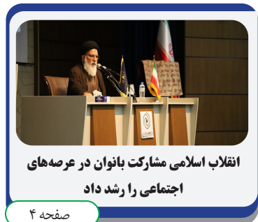
انقلاب اسلامی مشارکت بانوان در عرصه های اجتماعی را رشد داد