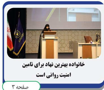
خانواده بهترین نهاد برای تأمین امنیت روانی است