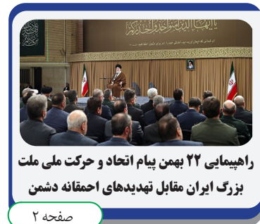
راهپیمایی ۲۲ بهمن پیام اتحاد و حرکت ملی ملت بزرگ ایران مقابل تهدیدهای احمقانه دشمن