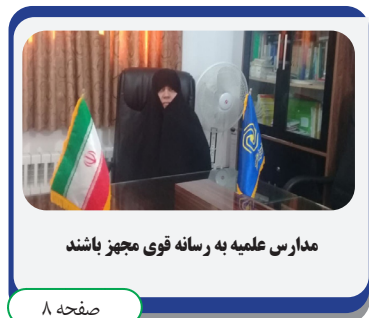
مدارس علمیه به رسانه قوی مجهز باشند