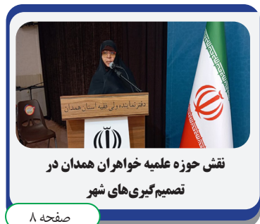
نقش حوزه علمیه خاوران همدان در تصمیم گیری های شهر