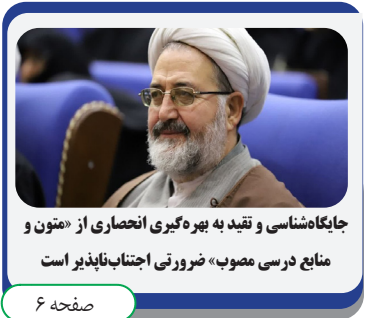
جایگاه فلسفی و تقید به بهره گیری انحصاری از «متون و منابع درسی مصوب» ضرورتی اجتناب ناپذیر است