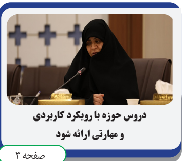
دروس حوزه با رویکرد کاربردی و مهارتی ارائه شود