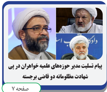
پیام تسلیم مدیر حوزه های علمیه خاوران در پی شهادت مظلومانه دو قاضی برجسته