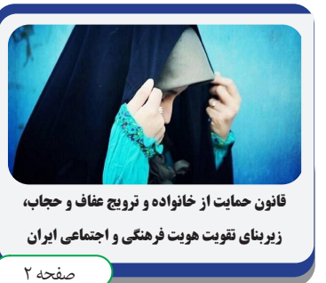
قانون حمایت از خانواده و ترویج عفاف و حجاب، زیربنای تقویت هویت فرهنگی و اجتماعی ایران