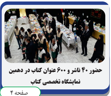
حضور ۴۰ ناشر و ۶۰۰ عنوان کتاب در دهمین نمایشگاه تخصصی کتاب