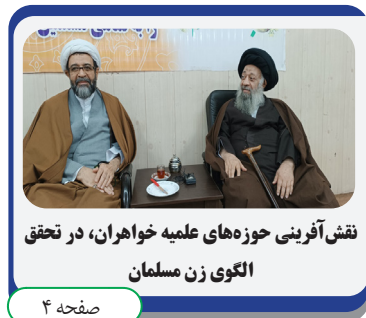
نقش آفرینی حوزه های علمیه خاوران، در تحقق الگوی زن مسلمان