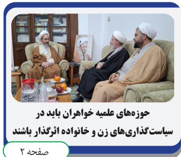
حوزه های علمیه خاوران باید در سیاست گذاری های زن و خانواده اثرگذار باشند