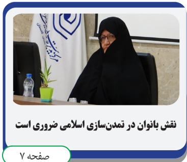
نقش بانوان در تمدن سازی اسلامی ضروری است