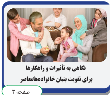
نگاهی به تأثیرات و راهکارها برای تقویت بنیان خانواده معاصر