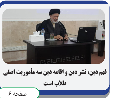
فهم دین، نشر دین و اقامه دین سه مأموریت اصلی طلاب است