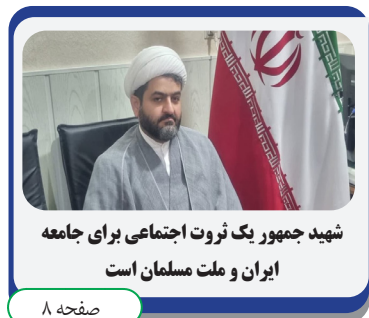
شهید جمهور یک ثروت اجتماعی برای جامعه ایران و ملت مسلمان است